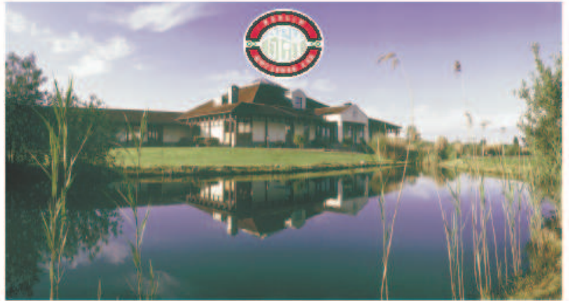
Berliner Golf & Country Club Motzener See e.V.